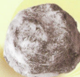
Truffe marc de champagne nuage sucre glace