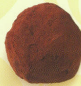
Truffe caramel poudrée cacao