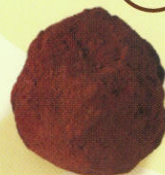
Truffe poire poudrée cacao noir