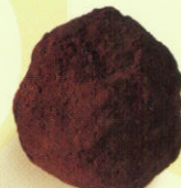
Truffe chocolat noir poudrée cacao extra noir